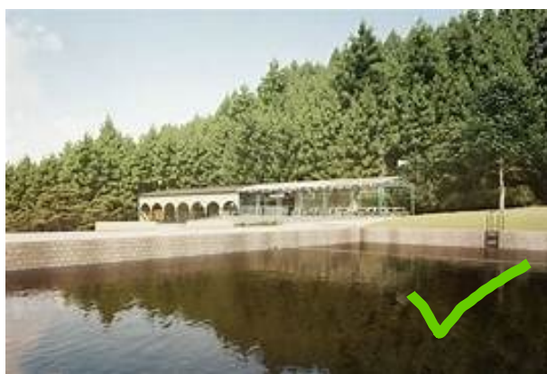
Lesní koupaliště v Liberci, Mjolk s.r.o.

Realizace rekonstrukce koupaliště podle současného projektu bude znamenat nenávratnou proměnu tohoto místa . Navýšení služeb o wellness, velkou restauraci, parkoviště a celoroční provoz ustoupí kus přírody. Budova ve stylu autobusového nádraží změní charakter místa. Tak velkou investici bude také potřeba zaplatit – a kdo jiný jí zaplatí, než budoucí návštěvníci? Nynější vstupné 100 Kč na den bude jistě minulostí.